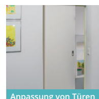
Anpassung von Türen