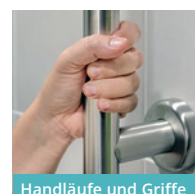
Handläufe und Griffe